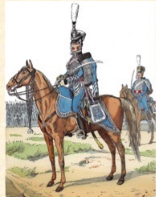
Sächsische Husaren 1810