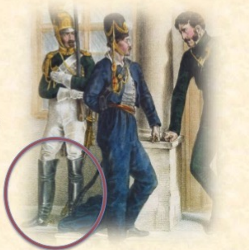
Links: Ehrengardist der Wache vor dem Hauptquartier Eugens, A. Adam

Eine Einheit traf es ganz hart. Die Männer der italienischen Guardia d'onore, eine Kadetteneinheit, die sich aus der Aristokratie Norditaliens rekrutierte, standen zwar im Offiziersrang, dienten aber als einfache Soldaten und wurden allgemein bemitleidet, weil ihnen sämtliche Fertigkeiten eines richtigen Soldaten fehlten. Sie hatten ihre Pferde verloren und stapften unbeholfen in ihren unpraktischen langschäftigen Stiefeln einher, anstatt sie zu kürzen. Sie waren zu verwöhnt, als daß sie je gelernt hätten, wie man sein Schuhwerk ausbessert oder einen Riß in der Uniform näht, und erst recht nicht, aus dem, was es gerade gab, einen Eintopf zu kochen. Außerdem waren sie zu wohlerzogen, um sich zum Plündern herabzulassen oder auch nur einem toten Soldaten die Taschen umzudrehen. Lediglich acht von ursprünglich 350 Mann überlebten, was selbst in diesem Feldzug äußerst wenige waren.