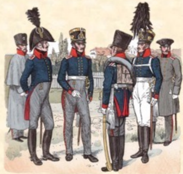
Preußen 1812 im Russlandfeldzug – eher weniger bunt