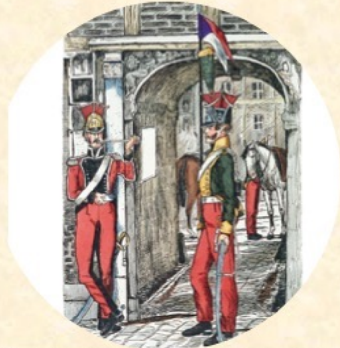
Frankreich. 9. Chevaulegers-Lancier-Regiment 1812.

Zitat Cordes – „Selbstversorgung“, S. 47